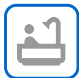
Gestion eau chaude