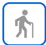
Aide à l'autonomie

Nous tenons à vous proposer les solutions les plus éthiques possibles, durables, évolutives, soucieuses de votre vie privée et de l'environnement.